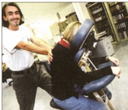
Avec « Massassiss », le massage vient à votre rencontre. Cela peut aussi être une idée cadeau au sein de votre entreprise. Duchateau

Ce service s'adresse notamment aux cadres, ouvriers, employés, patrons, hôtesses, barman, exposants... Sur le lieu de travail, lors de séminaires, conférences... À la demande, la prestation se paie entre 500 et 600 F HTVA le quart d'heure, auxquelles il faut ajouter des frais de déplacement. Un